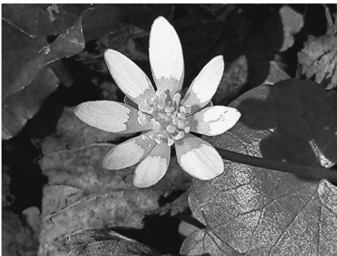
Frühlingsscharbockskraut (Rolf Jürgens)

Im März kann man im Federseemoor schon einige Frühlingsboten entdecken. Wiesenpieper und Feldlerchen kommen aus den Winterquartieren zurück und besetzen ihre Reviere. Ab Mitte März sind auch die Rohrweihen aus Afrika zurück-