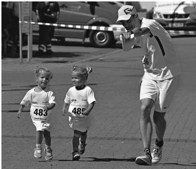
Auch die Kleinsten sind mit Feuereifer dabei

Nach der Seerunde muss noch ein kleiner Umweg Richtung Wackelwald gemacht werden bevor es durch den Kurpark wieder auf den Marktplatz in Richtung Ziel geht. Entlang der Strecke befinden sich mehrere Versorgungsstationen mit Wasser, teilweise auch mit Obst und Iso-Getränken. Die Läuferinnen und Läufer freuen sich über viele Zuschauer und eine lautstarke Unterstützung. An dieser Stelle ein herzliches Dankeschön schon im Voraus an alle Sponsoren, alle beteiligten Institutionen und Vereine aus den Federseeegemeinden und Bad Buchau, die hier dem SVB helfend zur Seite stehen. Während die Läuferinnen und Läufer den See umrunden, finden die weiteren Läufe statt. Angeboten werden auch dieses Jahr ein 5-km-Lauf für Jugendliche und Erwachsene, die Kinderläufe U10 und U12 über 1,7 km und natürlich dürfen die jüngsten Sportlerinnen und Sportler, die Bambini nicht fehlen. Sie absolvieren eine Runde über 400 m durch die Innenstadt. Ebenfalls mit von der Partie sind die Walkerinnen und Walker, die eine Strecke von ca. 8 km zurücklegen müssen. Hierbei bietet sich für Firmen, Vereine und sonstige Institutionen die Möglichkeit, sich als Gruppe sportlich zu betätigen. Eingeladen sind sowohl sportliche Walkerinnen und Walker, wie auch Genussläuferinnen und -läufer, bei denen die erreichte Zeit nicht unbedingt an erster Stelle steht.