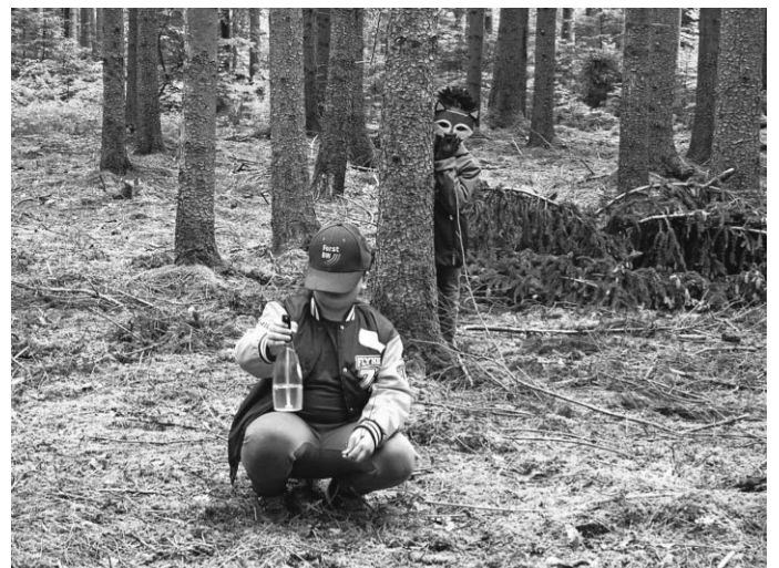
Zwei Kinder beim Fuchs-und-Hase-Spiel.