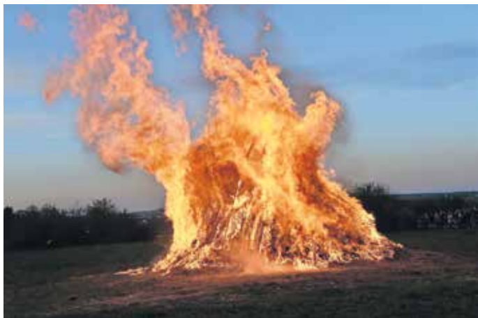
Funkenfeuer auf Kappels Höhe