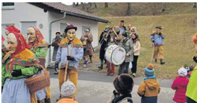
Narrenbefreiung Kindergarten Reichenbach

Am Gumpigen Donnerstag, 08. Februar 2024 bekamen wir Besuch von den Narren und der Kondemusik. Wir wurden um 11 Uhr von den Narren und der Konde befreit und es wurde kräftig gefeiert. Ein Dank hierfür an die Eltern, die wieder mal ein leckeres Buffet organisiert und uns an diesem Tag unterstützt haben. Ebenfalls vielen Dank an alle Mitwirkenden!