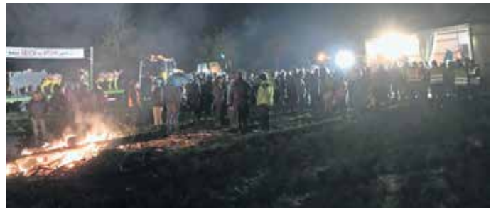
Viele Besucher trafen sich zum Allmannsweiler „Mahnfeuer“.

Mit einem Mahnfeuer machte am 01. Februar die örtliche Landwirtschaft auf die drohenden Kürzungen in der Subventionspolitik der Bundesregierung aufmerksam.