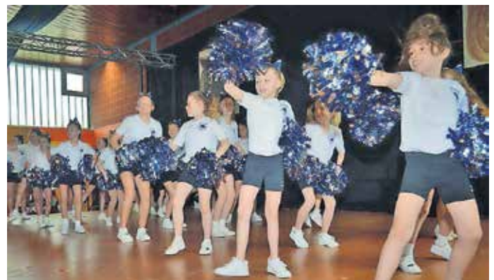
Cheerleader „Blue Pearls“ aus Oggelshausen

Wieder ein voller Erfolg war der Kinderball der Moorochsenzunft am Glompigen Donnerstag in der erneut proppenvollen Festhalle bei der Federseeschule. Viele strahlende Kinderaugen freuten sich zusammen mit den Eltern und Großeltern auf den Kinderball mit seinem bunten Programm. Ausschließlich junge Bühnenstars sorgten wieder für einen bunten und abwechslungsreichen Nachmittag.