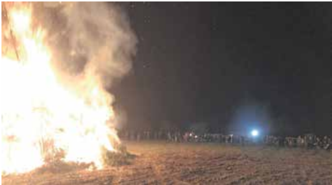
Zahlreiche Besucher beim Allmannsweiler Funken.

Enorm viele Kinder trafen sich letzten Samstag zum Funkenmarsch vor dem Rathaus. Als der lange Fackelzug sein Ziel erreichte, hatten die Kinder dann die größte Freude endlich den Funken anzuzünden. Das brauchte auch nicht lange bis der mit ausgesuchten Hölzern gebaute Funken lichterloh brannte. Bei bester Verpflegung in der Funkenhütte durften sich die zahlreichen Besucher auf den nahenden Frühling freuen. Ein herzliches Dankeschön gilt dem Funkenteam und allen Helfern, für den Erhalt dieses Brauchtums.