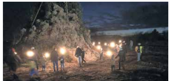
Gespannt warten die Kinder auf den Startschuss....